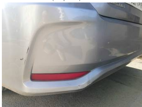
Bouclier arrière (Impact)