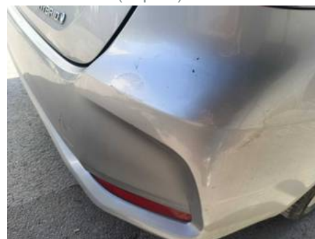
Bouclier arrière (Impact)