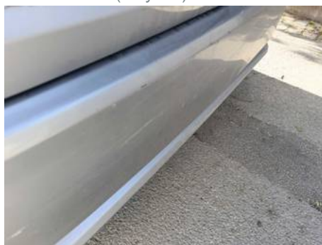
Bouclier arrière (Rayure)